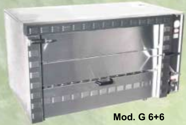
Mod. G 6+6