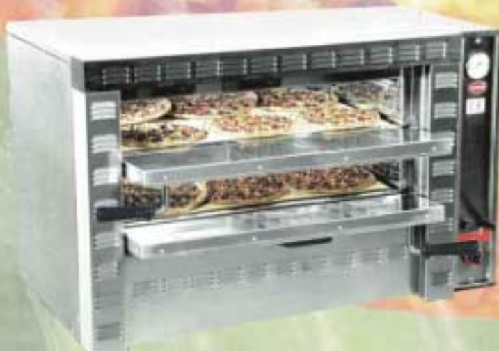
Mod. G 6+6