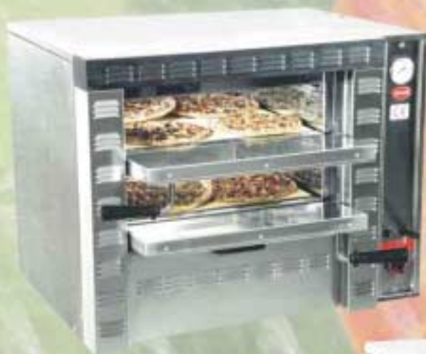
Mod. G 4+4