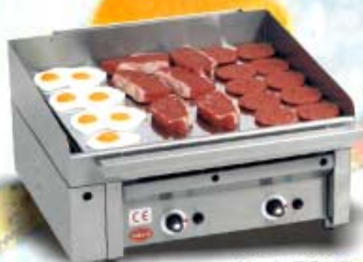
Mod. ZONE 2