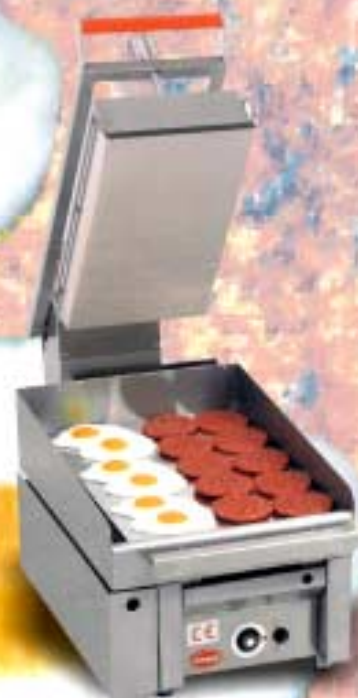
* Mod. ZONE 1