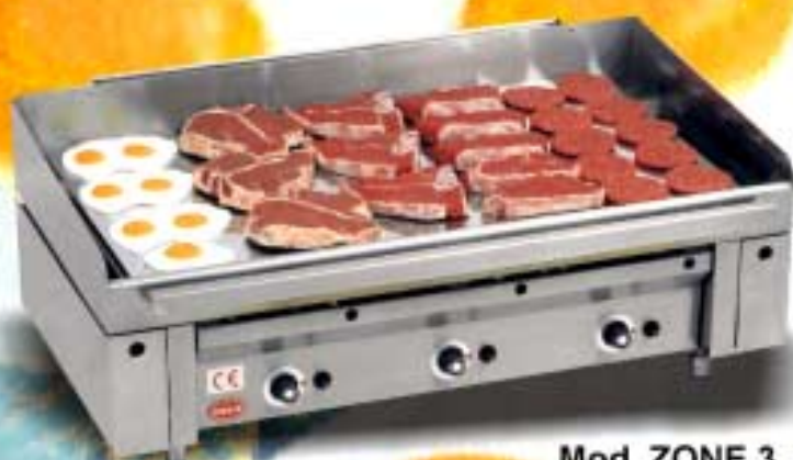
Mod. ZONE 3