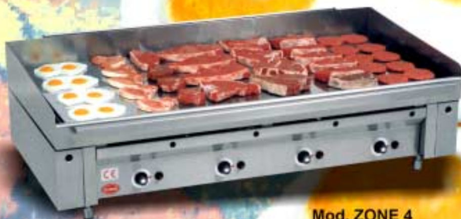
Mod. ZONE 4